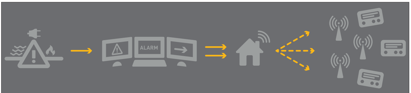
Bild 1. Alarmierungsprozess

Ein Stromausfall durch eine Störung des Netzbetriebs hat zumeist erhebliche Auswirkungen auf das öffentliche Leben und den Alltag der Bevölkerung im betroffenen Gebiet. Umso wichtiger ist es, dass die Störungsbeseitigung schnellstmöglich beginnt. Eine zuverlässige Alarmierung der Bereitschaftsdienste muss darum essenzieller Bestandteil des Störungsmanagements von Versorgungsunternehmen sein. Digitaler Funkruf stellt die Alarmierung von Einsatzkräften auch dann sicher, wenn Fest- und Mobiltelefonnetze überlastet sind oder wegen fehlender Stromversorgung ausfallen.